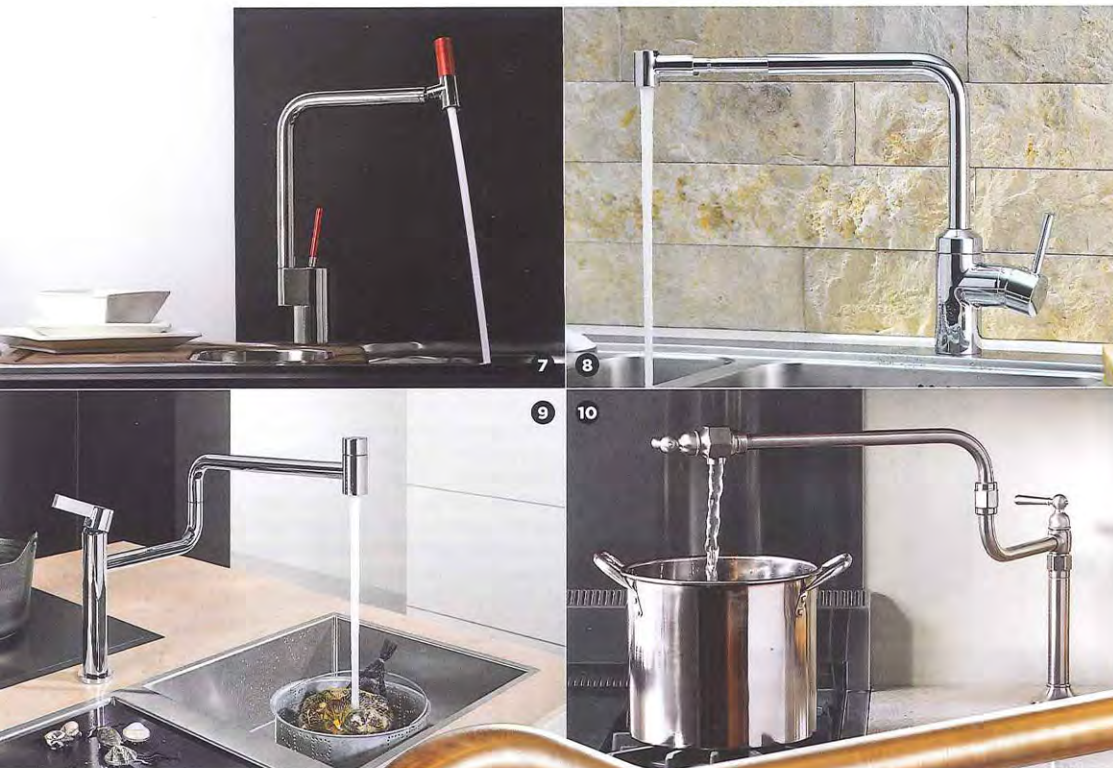
7. 360° Evolution, Weber . Излив смесителя вращается на 360°. 8. L-line, Kludi . Однорычажный смеситель с выдвижным и поворотным изливом. 9. Pivot, диз. Sieger Design, Dornbracht . Вращается на 360°. 10. HiRise, Kohler . Шарнирно-поворотный излив. 11. RBRO02, Restart . Поворотный излив. 12. Como, Villeroy & Boch . Съемный смеситель.